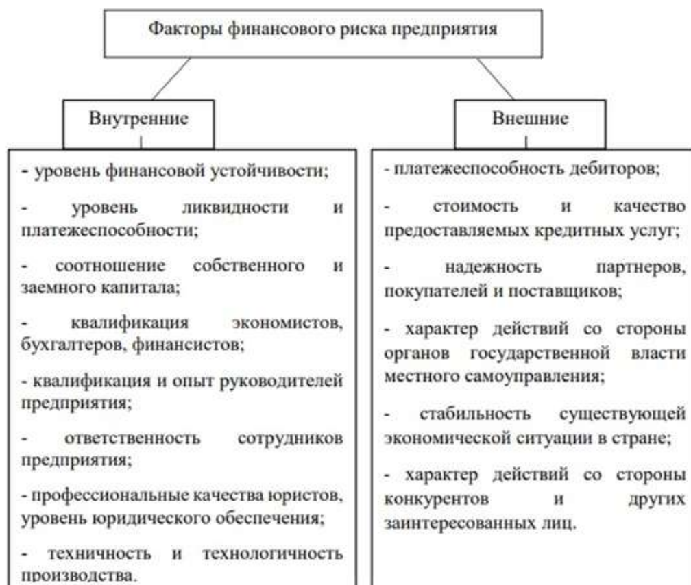
Рис. 1 – Факторы финансового риска предприятия

5. управление финансовыми инновациями (внедрение современных финансовых технологий и эффективных организационных систем управления);