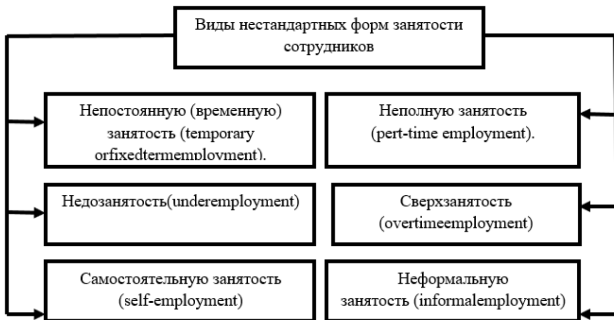
Рисунок 1 - Виды нестандартных форм занятости сотрудников

японской модели построения карьерной лестницы. В настоящий момент все большую популярность набирают, как у работодателей, так и у работников нестандартные формы занятости или альтернативные формы (рис. 1).